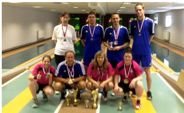
Přeborníci ČOS 2014

Po získání mistrovského titulu ČOS vybojovali hráči A družstva mužů T.J. Sokol Husovice také vítězství v Superpoháru ČKA.