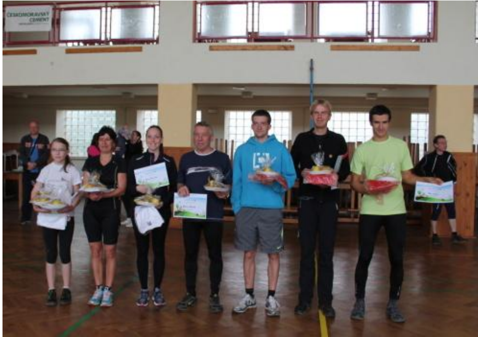
Vítězové pozořické Jarní lesní sokolské devítky