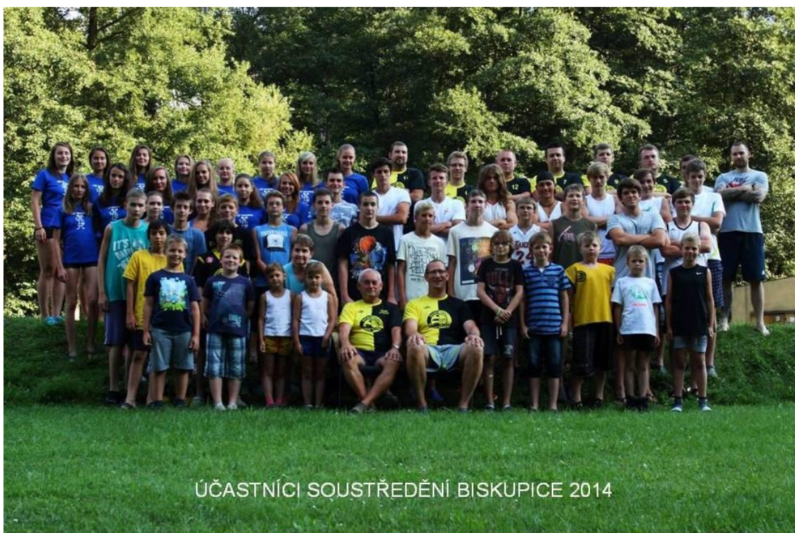
ÚČASTNÍCI SOUSTŘEDĚNÍ BISKUPICE 2014