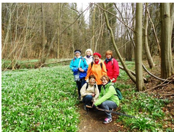
Jaro v Údolí Chlébského potoka