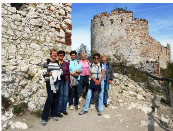
Podzim na Pálavě