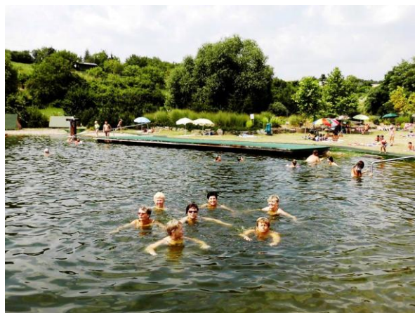
Léto v Kovalovicích