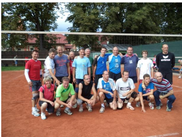
Volejbalová družstva žen a mužů Grimma-Hohnstadt a T.J.Sokol Bučovice