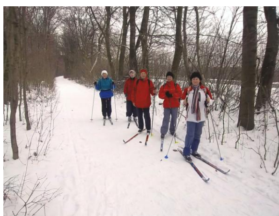
Zima na Velké Klajdovce