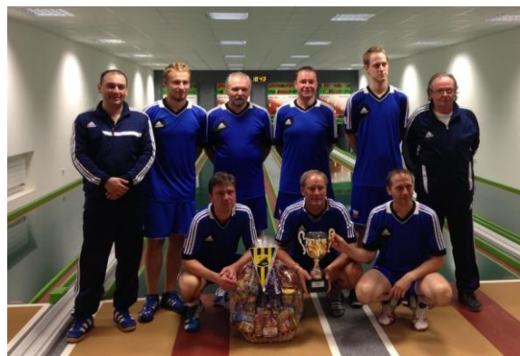
Vítěz Superpoháru ČKA 2014